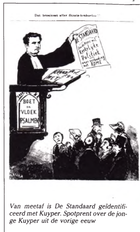
Van meetaf is De Standaard geïdentificeerd met Kuyper. Spotprent over de jonge Kuyper uit de vorige eeuw

Wat voor eigenschappen de mannen achter De Standaard in verhouding tot Kuyper