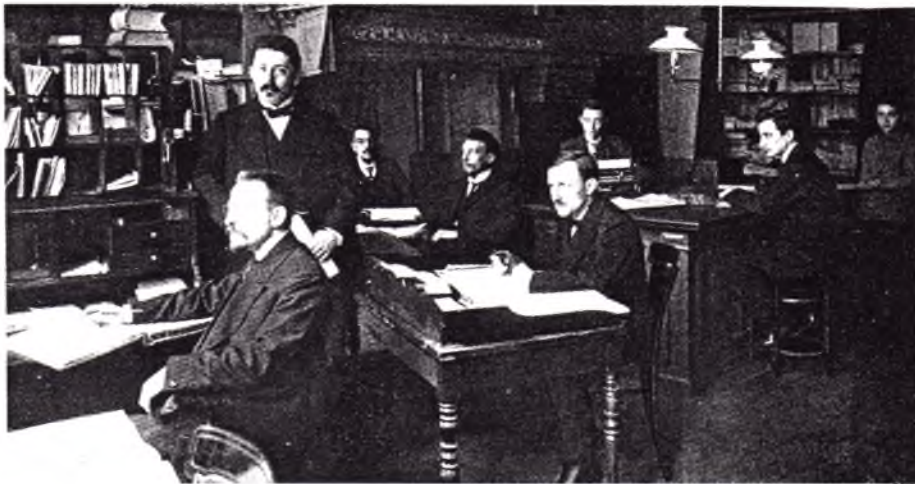
De administratie van De Standaard omstreeks 1912

Kuyper was ten einde raad en had de hoop op behoud van het blad eigenlijk al opgegeven, het personeel was inmiddels ontslag aangezegd, toen Kruyt op de valreep op eens zijn uitgeverservaring benutte en met een reddingsplan op de proppen kwam, dat De Standaard voor de eerstvolgende jaren voldoende kapitaal moest opleveren om de uitgave ervan op een gezonde financiële basis te kunnen voortzetten. Kruyt zette dit plan door en wist na verloop van een aantal maanden ruimschoots het beoogde bedrag onder de achterban in te zamelen, ja zelfs aanzienlijk meer!