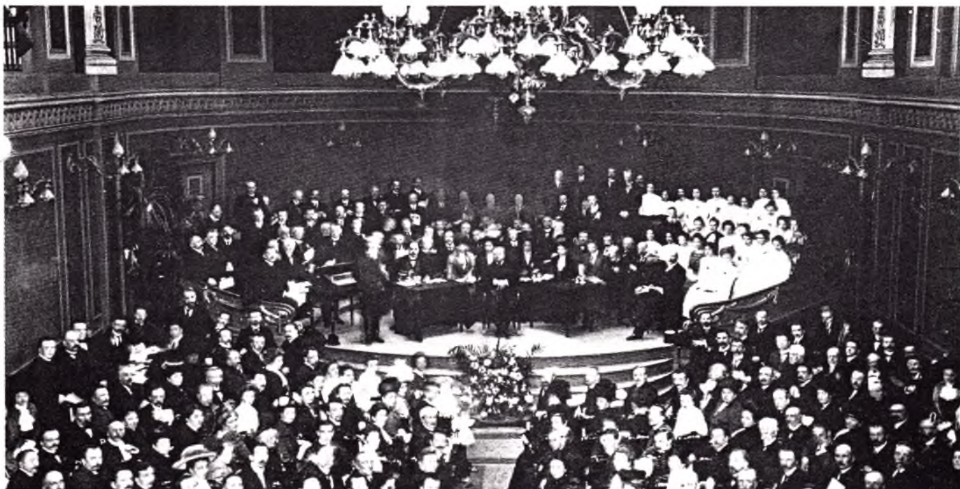
Toen Kuiper zich in 1912 liet huldigen omdat De Standaard 40 jaar bestond, zaten in de zaal van het gebouw voor Kunsten en Wetenschappen te Utrecht meer mensen dan het dagblad abonnees telde

Feit is ondertussen, dat tot zijn dood toe Kuiper en hij alleen voor de buitenwacht de verpersoonlijking van De Standaard was en bleef, ook al nam zijn zeggenschap over de krant, zoals beschreven, in de loop der jaren af. Enerzijds droeg hiertoe in het begin van deze eeuw de nieuwe generatie antirevolutionaire voormannen, zoals Colijn en Idenburg, bij, die alleen door de alomgeëerde hoofdredacteur eindeloos te prijzen, konden hopen onder zijn duiven te schieten. Anderzijds werkte ook Kuipers presentatie zijn hele leven lang deze situatie volledig in de hand. Een geliefkoosde vergelijking stelde hemzelf, de hoofdredacteur van De Standaard, voor als de grote calvinistische veldheer en het personeel van de krant (net zoals de antirevolutionairen in het algemeen) als de hem onderhorige, volgzaam soldaten. Je vraagt je wel eens af, of het voetvolk en vooral Kuipers subalterne officieren zich deze beeldvorming en de eruit sprekende gezagsverhou-