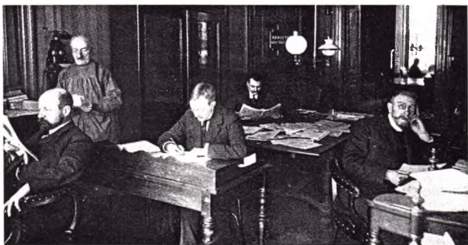
De redactie van De Standaard omstreeks 1912

Aan het bekijken van dit beeld heeft Kuyper tot het einde van zijn leven welbewust meegewerkt. Enerzijds heeft hij zich vanaf het begin in zijn particuliere correspondentie, o.a. tegenover Groen van Prinsterer, regelmatig uitgesproken over de belasting die zijn hoofdredacteurschap voor hem be-